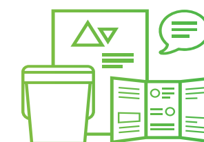
material gràfic de campanya