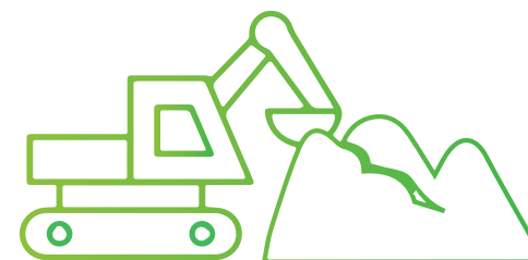
piles de compost